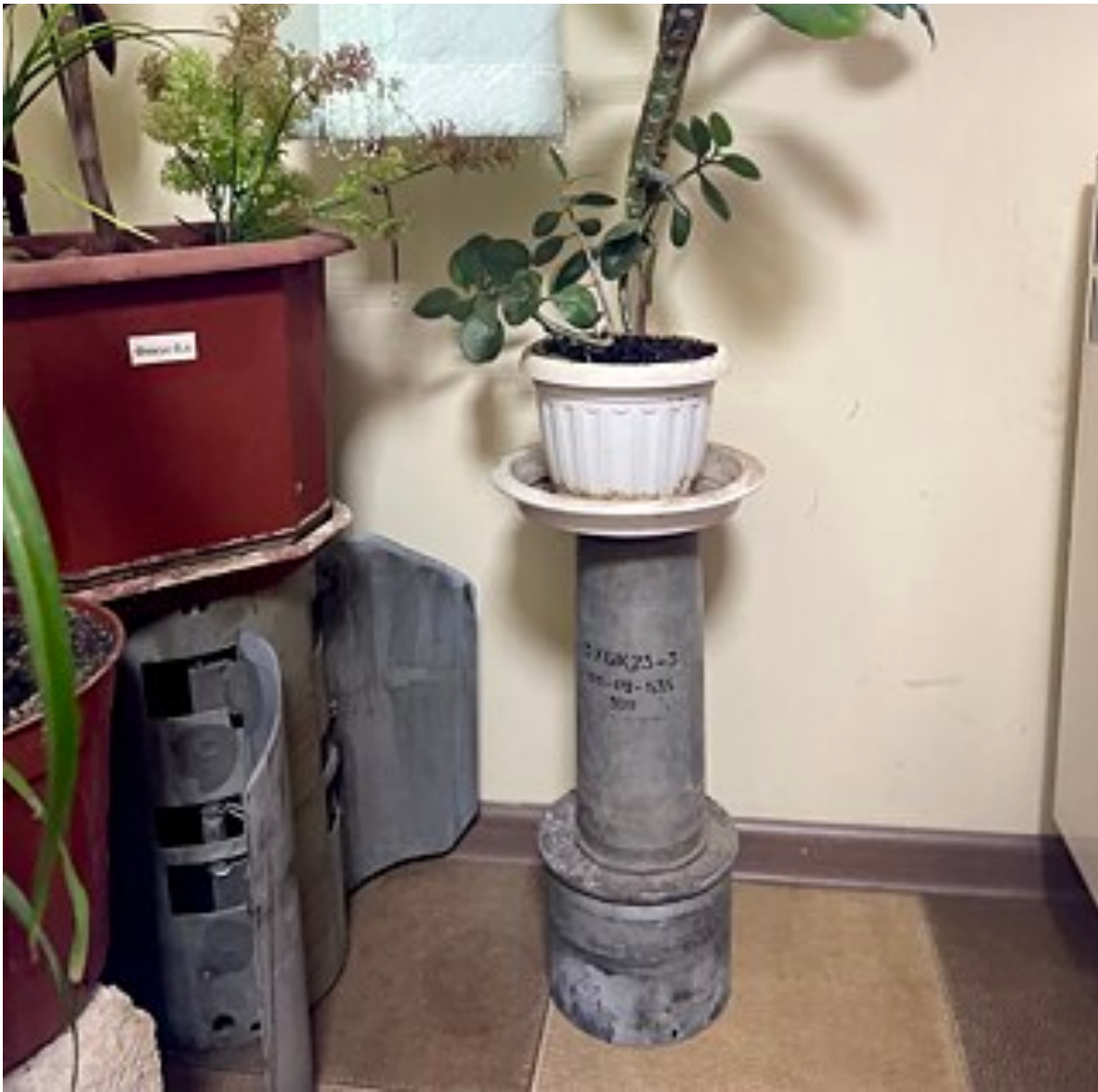
Die Überreste russischer Geschosse dienen in dieser Bibliothek in der Oblast Mykolajiw als Ständer für Blumentöpfe.