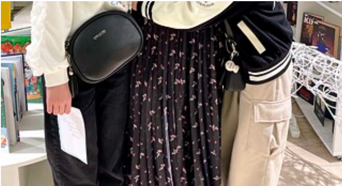
Kateryna Yehorushkina mit Leserinnen in einer Bibliothek in Mykolajiw |