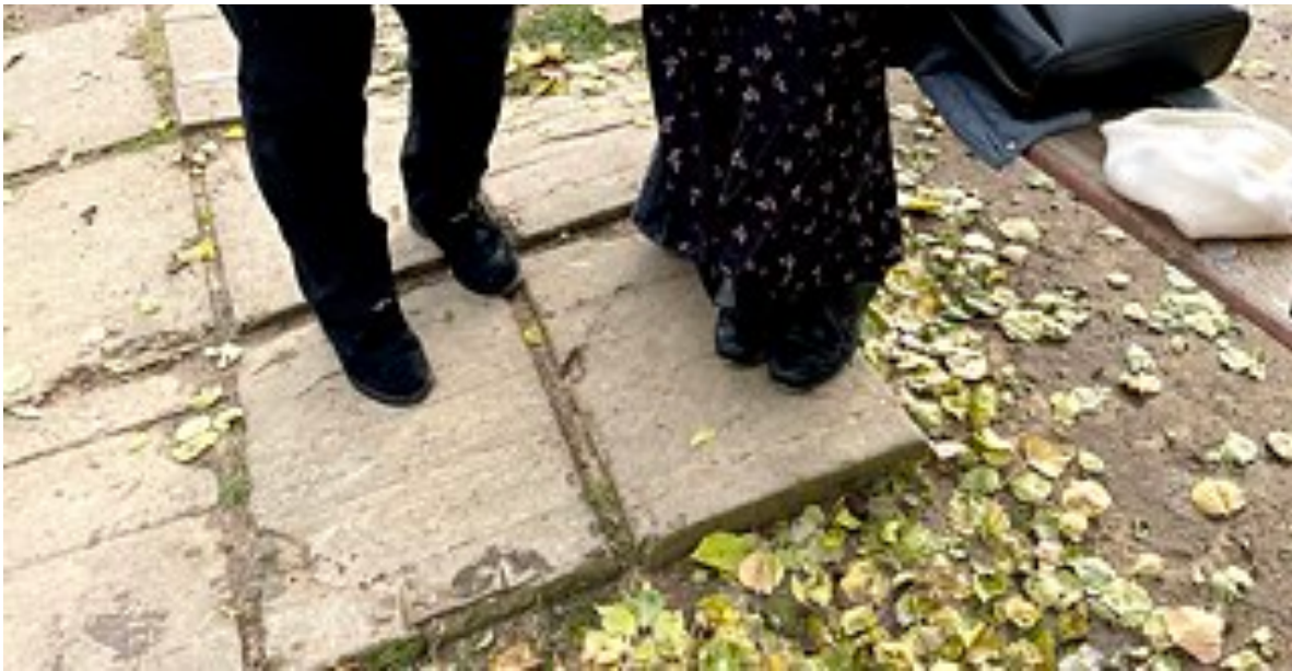
Kateryna signiert ihr Buch im Süden der Oblast Mykolajiw während in einiger Entfernung Explosionen zu hören sind.