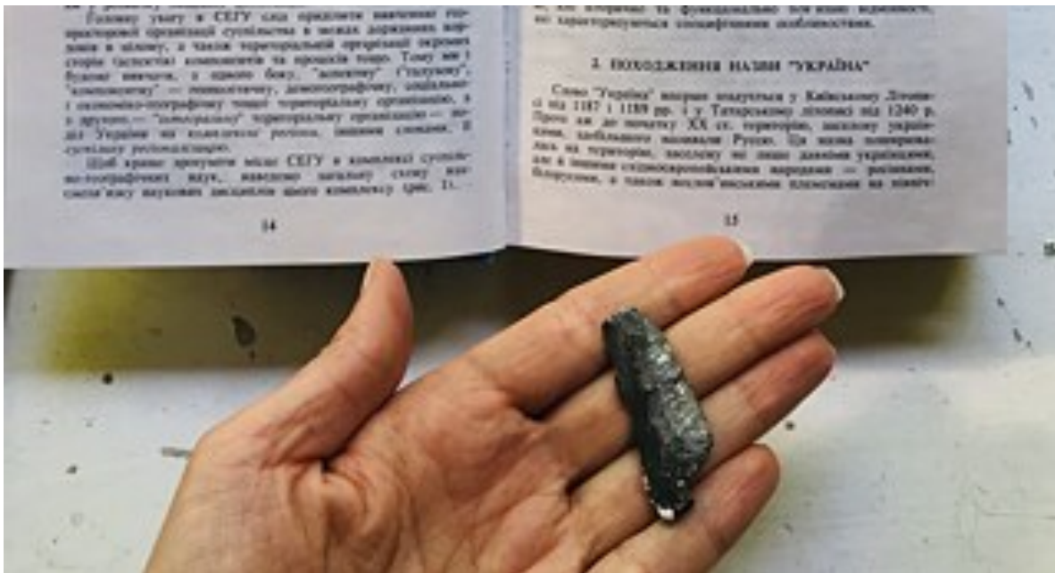
Ein durchgeschossenes Buch in Obuchowytschi, Oblast Kyjiw