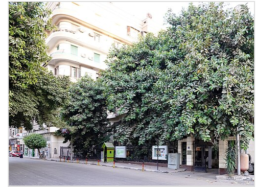
Goethe-Institut in Kairo