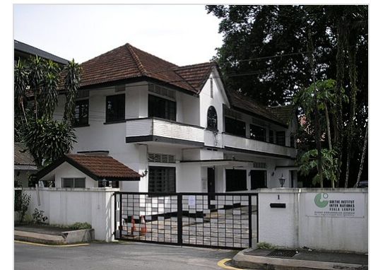
Goethe-Institut in Kuala Lumpur