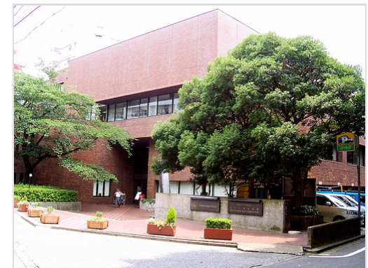
Goethe-Institut in Tokio