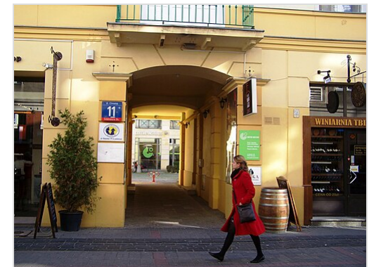
Goethe-Institut in Warschau