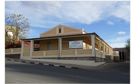
Goethe-Institut in Windhoek