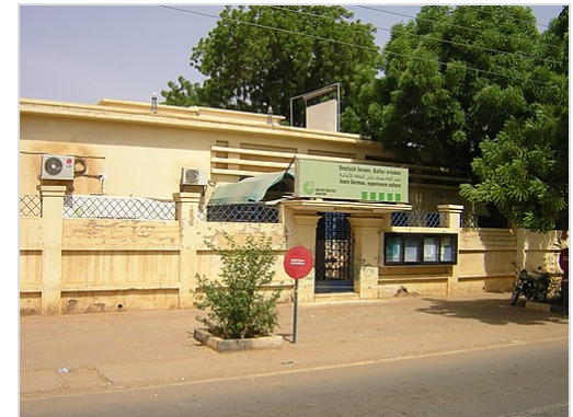
Goethe-Institut in Khartum