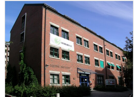
Goethe-Institut in Oslo