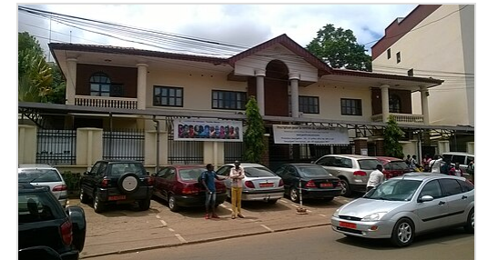
Goethe-Institut in Yaoundé