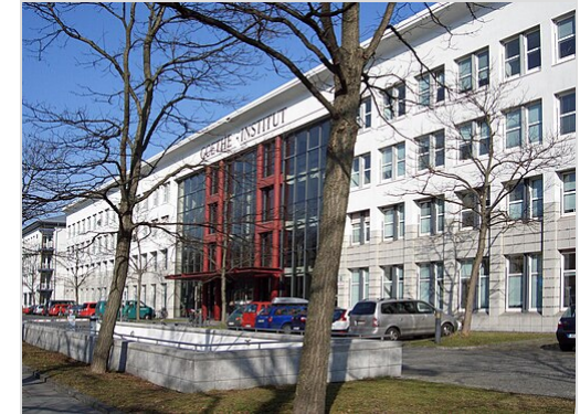
Ehemalige Zentrale in der Dachauer Straße , München