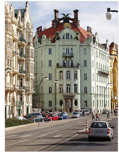
Goethe-Institut in Prag